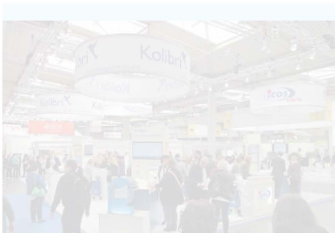
Bei der Fachgroßhandelsgruppe Igefa ging es um das neue Inkontinenzsortiment (Kolibri) ebenso wie um die Pflegeserie HydroVital.

Heike Holland | heike.holland@holzmann-medien.de