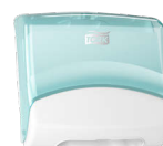
654000 Tork Performance Tuchspender