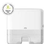
552100 Tork Xpress Multifold Mini