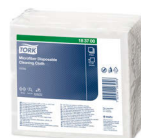
183700 Tork Mikrofaser-tücher, Einmalgebrauch