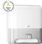
551100 Tork Matic® Handtuchspender mit Intuition™ Sensor