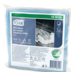
183600 183601, 183602, 183603 Tork Mikrofaser-tücher, wiederverwendbar